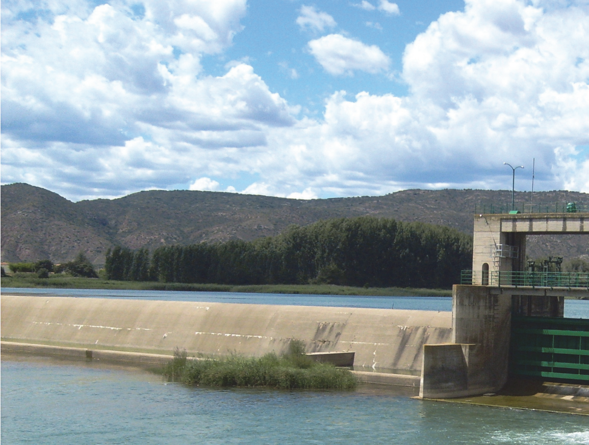
Figura 2: Presa del embalse de Balaguer